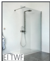
EI TWF : montage à gauche ou à droite